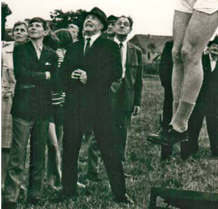
Zeichnung: Andreas Reiberg

■ Boßeln, Klootschießen und Schöfeln: Früher, in den kalten Wintern Frieslands, haben sich spezielle Sportarten entwickelt, die noch heute als sportliches und geselliges Ereignis einen hohen Stellenwert in der Region haben. Gefrorene Weiden und Wiesen, vereiste Gräben und Tiefs sind die Voraussetzung, um mit Schlittschuhen zu gleiten oder Holzkugeln - mit oder ohne Eisenkern - auf die Bahn zu bringen.